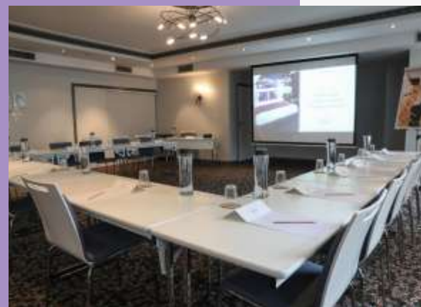
Sous disposition U dans un salon de 55m 2