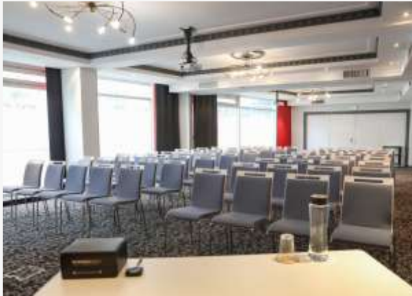
Sous disposition théâtre dans un salon de 150m 2