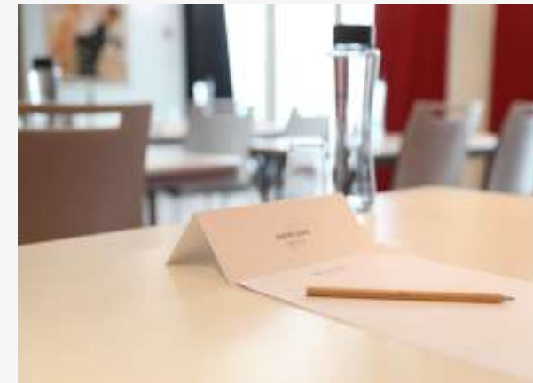
Sous disposition îlot dans un salon de 90m 2

500m 2 d'espaces séminaires à la lumière du jour