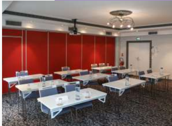
Sous disposition classe dans un salon de 60m 2